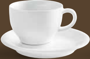
Cappuccino International-Obertasse, bordglasiert cappuccino international cup, rim glazed 0,23 l *, 6,4 cm hoch/high Art. Nr. 21 5126PRO Kombi-Untertasse / saucer