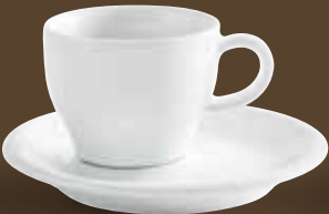
Kaffee-Obertasse coffee cup 0,19 l *, 6,8 cm hoch/high Art. Nr. 21 4703PRO Kombi-Untertasse / saucer