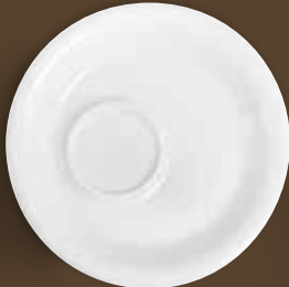
Café Crème-Untertasse café crème saucer 14,5 cm Art. Nr. 21 3554PRO