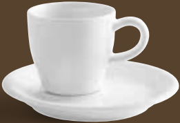
Café Crème-Obertasse, bordglasiert café crème cup, rim glazed 0,11 l *, 6,8 cm hoch/high Art. Nr. 21 5113PRO Untertasse / saucer