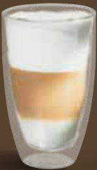
Latte Macchiato-Glas, doppelwandig latte macchiato glass, double wall 0,25 l *, 12,6 cm hoch/high Art. Nr. ME 9968PRO