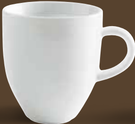
Maxibecher, bordglasiert large mug, rim glazed 0,50 l *, 11,3 cm hoch/high Art. Nr. 21 5127PRO