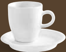
Espresso Doppio-Obertasse, bordglasiert espresso doppio cup, rim glazed 0,05 l *, 6,2 cm hoch/high Art. Nr. 21 5124PRO Kombi-Untertasse / saucer