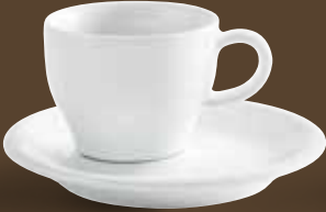
Cappuccino Italiano-Obertasse, bordglasiert cappuccino italiano cup, rim glazed 0,18 l *, 6,8 cm hoch/high Art. Nr. 21 5125PRO Kombi-Untertasse / saucer