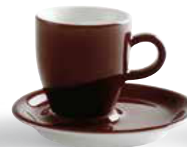
schokobraun/chocolate brown 69-122

Colour your table with Café Sommelier 2.0: Espresso and cappuccino lovers can choose between shining chocolate brown, taupe, petrol and red.