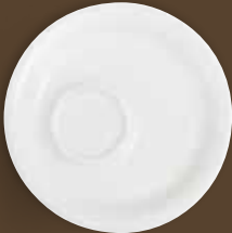
Espresso-Untertasse saucer 11,7 cm Art. Nr. 21 3518PRO