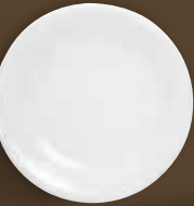
Aromasiegel midi flavour seal midi 10 cm Art. Nr. 21 7841PRO