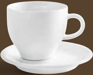
Milchkaffee-Obertasse café au lait cup 0,37 l *, 8,7 cm hoch/high Art. Nr. 21 4775PRO Kombi-Untertasse / saucer