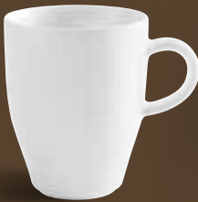
Kaffeebecher, bordglasiert mug, rim glazed 0,32 l *, 10,5 cm hoch/high Art. Nr. 21 5330PRO