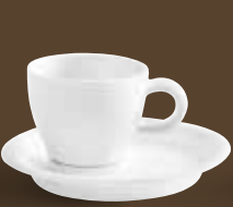
Espresso-Obertasse, bordglasiert espresso cup, rim glazed 0,03 l *, 4,8 cm hoch/high Art. Nr. 21 5123PRO Kombi-Untertasse / saucer